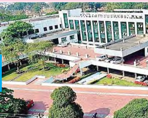
ద్రాయింగ్ డ్రాయింగ్లో ఏళ్ల తరబడి ఒకే పాఠశాల విధులు నిర్వహిస్తున్న వర్గ ఇన్స్టిట్యూట్లను మాత్రం కనీసం కదిలించకపోవడం

(ప్రభాతపార్ల విశాఖపట్నం) గ్రేటర్ విశాఖ మున్సిపల్ కార్పొరేషన్ (జీవీఎంసీ) ఇంజనీరింగ్ విశాఖలో వర్గ ఇన్స్టిట్యూట్ బదిలీ వ్యవహారం కుంభకోణం రాజీనామా. ఒకే కేంద్ర, ఒకే హోదాలో పనిచేస్తున్న వర్గ ఇన్స్టిట్యూట్ విషయంలో ఉన్నతాధికారుల ద్వంద్వ నీతి ప్రదర్శిస్తున్నారనే